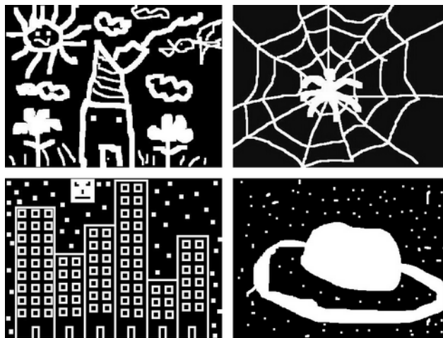
Figura 3 – Miniaturas de trabalhos da Tarefa 1, conseguidos pela “raspagem” com a ferramenta Borracha.

Nesta tarefa, a cor proposta para o fundo tem sido o preto, deixando, no entanto, liberdade para se utilizarem outras. Tem-se verificado que os melhores resultados se conseguem com a cor proposta.