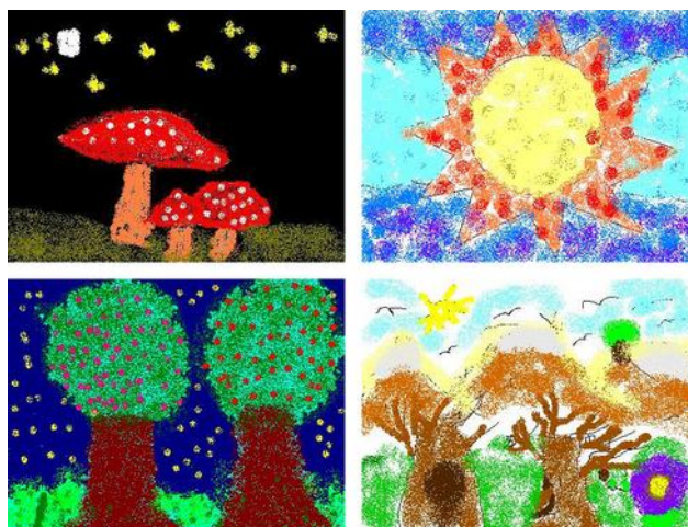
Figura 4 – Miniaturas de trabalhos da Tarefa 3 (combinação do lápis com o aerógrafo)

Nas tarefas 1 a 7 as propostas de trabalho exigem imagens com 400x300 pixels enquanto na tarefa 8 (Figura 5) se exige que os produtos tenham a dimensão de 600x450 pixels. Estas condições cumprem um objectivo deliberado de chamar a atenção para características das imagens digitais que não são tão notórias quanto nas imagens analógicas: a dimensão. Por outro lado, consegue-se chamar a atenção para a adequação das áreas de desenho aos objectivos, poupando recursos que melhoram o desempenho dos computadores.