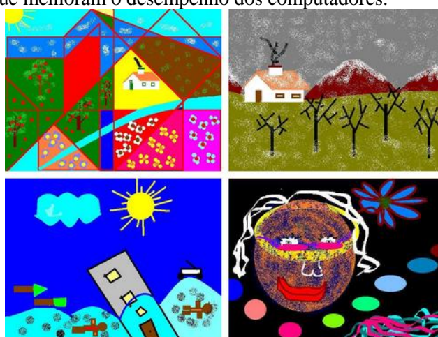
Figura 5 – Miniaturas de trabalhos da Tarefa final (criação livre)

Nas tarefas 1 a 7 as propostas de trabalho exigem imagens com 400x300 pixels enquanto na tarefa 8 (Figura 5) se exige que os produtos tenham a dimensão de 600x450 pixels. Estas condições cumprem um objectivo deliberado de chamar a atenção para características das imagens digitais que não são tão notórias quanto nas imagens analógicas: a dimensão. Por outro lado, consegue-se chamar a atenção para a adequação das áreas de desenho aos objectivos, poupando recursos que melhoram o desempenho dos computadores.