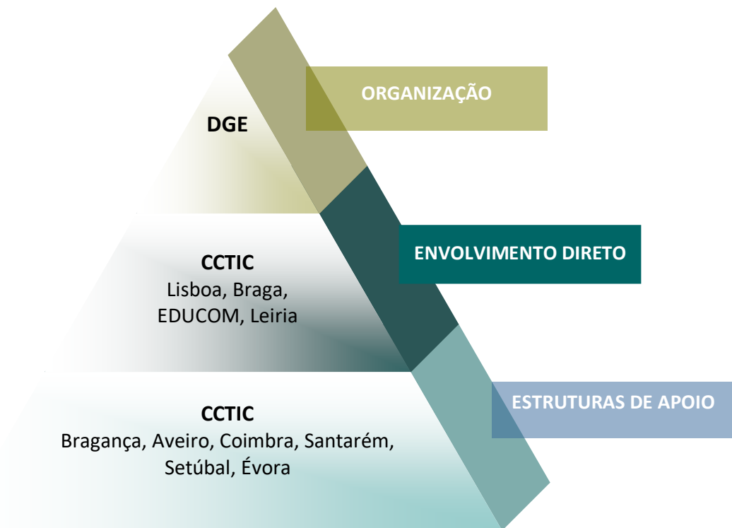
Imagem 1: Estrutura da organização do trabalho para o desenvolvimento do MOOC

Relativamente à metodologia de trabalho, no início foram promovidas diversas discussões em torno da estrutura e do conteúdo, em reuniões online e através de documentos partilhados. Posteriormente, no sentido de tornar o processo mais eficaz, foi adotada uma metodologia em pirâmide, tal como poderemos observar na imagem seguinte: