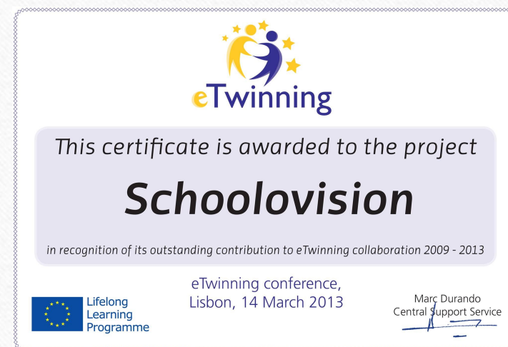
eTwinning Special Award 2013