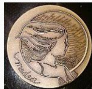
Medea Awards 2012