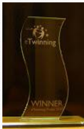
eTwinning Award 2010