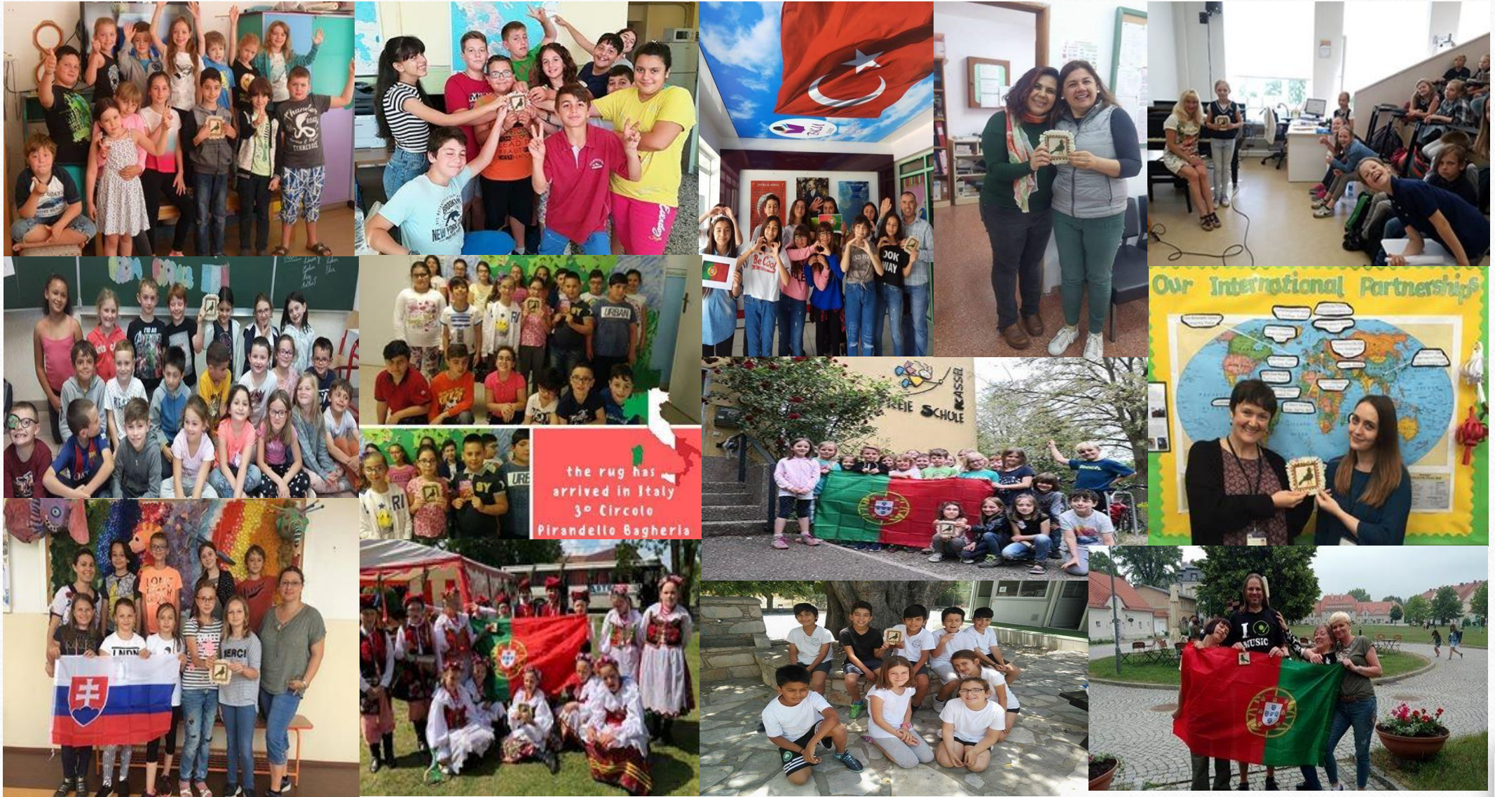
“Arraiolos Rug is travelling around Europe and beyond...”: