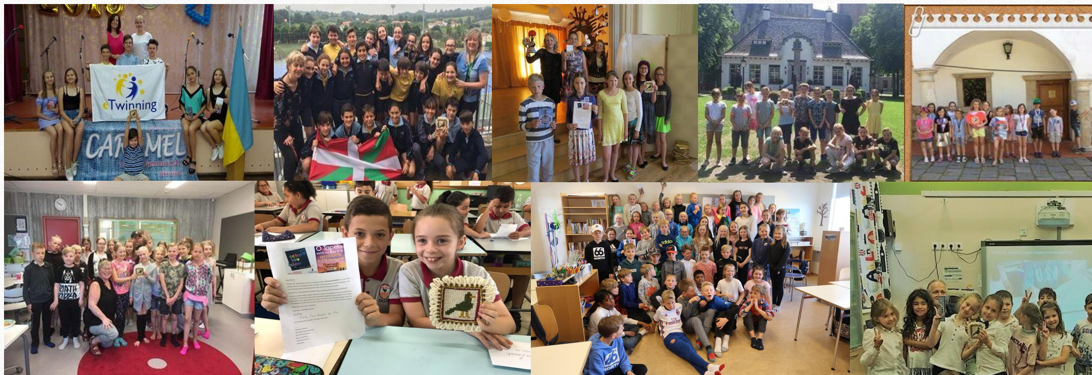
“Arraiolos Rug is travelling around Europe and beyond...”:

Ao divulgarmos o nosso património cultural, com o nosso famoso Tapete de Arraiolos, atento o tema de 2018, o Ano Europeu do Património Cultural, contribuiu-se para a divulgação e salvaguarda deste património cultural imaterial.