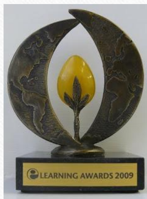
eLearning Awards 2009