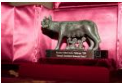
GJC Award 2009